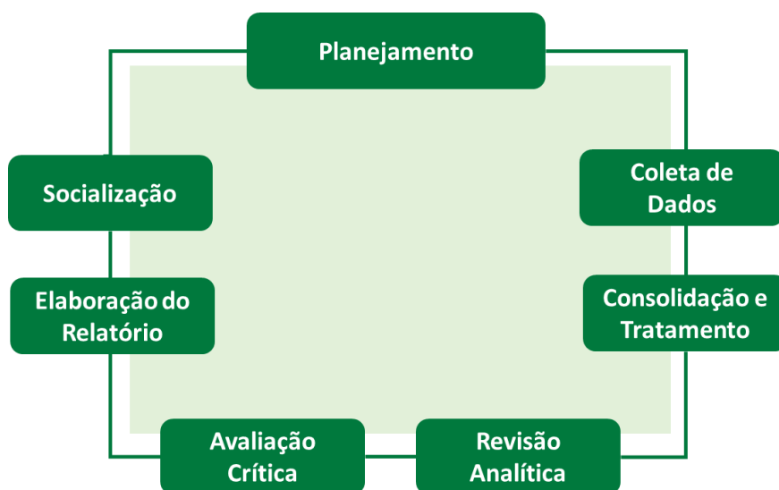
Figura 1 – Fases do processo de autoavaliação conduzido pela CPA

O processo de autoavaliação institucional atende às necessidades institucionais, como instrumento de gestão e de ação acadêmico-administrativa de melhoria institucional, com evidência de que todos os segmentos da comunidade acadêmica estão sensibilizados e se apropriam seus resultados.