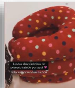
Lindas almofadinhas de pescoço saindo por aqui @faculdemodasenaihu